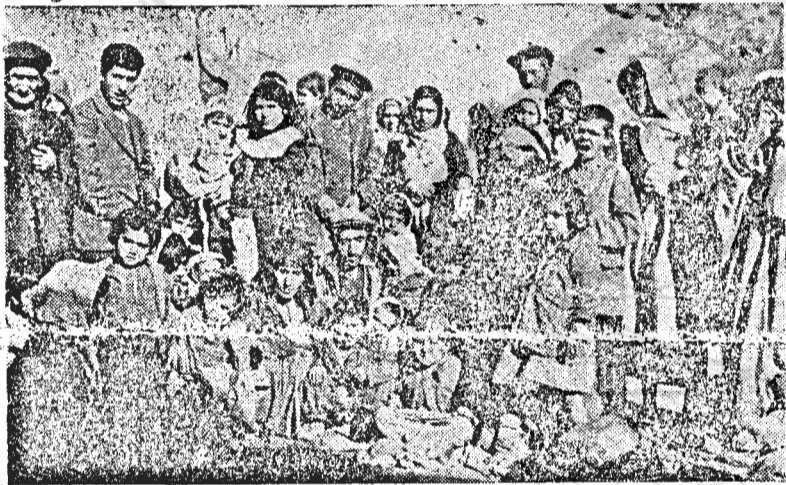
مردان و زنان و کودکان محروم و آواره یهودی درخه ها و گنیسهای محله با فقر و فلاکت دست بگریانند بقیه در صفحه ۲

متوسط الحال بسوی فقر و گرسنگی سوق داده میشوند