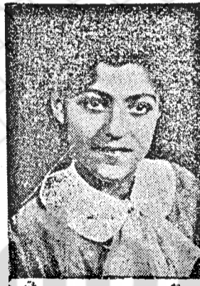
دوشنبه مهری همایونی

از تهران دوشنبه مهری همایونی در میان ششم دبستان در حوزه روحی با معدل ۱۶ ۲۸ شاگرد اول شده است