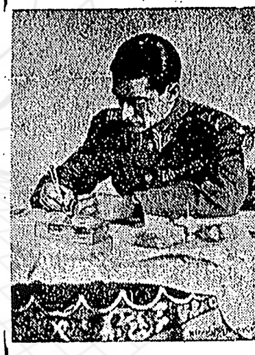
شرح در صحنه دوم

دعا برای سلامتی ذات ملو کانه در روز روزه بزرگی