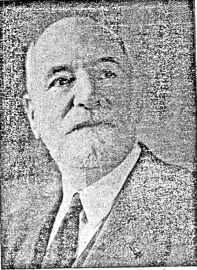
رنه کاسن (RENÉ CASSIN) رئیس فعلی الیانس اسرائیالیات (پاریس)

درود بی پایان بروان اطهر طائران قدس سماء الهی که در بسط و اشاعه تو حید، حق گرانی بگردن یکتا پرستان جهان دارند در بابان از قارئین محترم استعدا دارد چنانچه قلم نارسای نگارنده آنچنان که شاید حق مطلب را در پیش چنین عظیم ادان کرده باشد بر نگارنده منت گذارده و از رالطف غمش عین فرمایند - چه، ستونهای روزنامه هم بیش از این کجایش بخت در اطراف این معنای بزرگ را نداشت و از این رو؛ گفتنی ما سر بر سر ناکفته ماند در که باید مستقیم ناسفته ماند