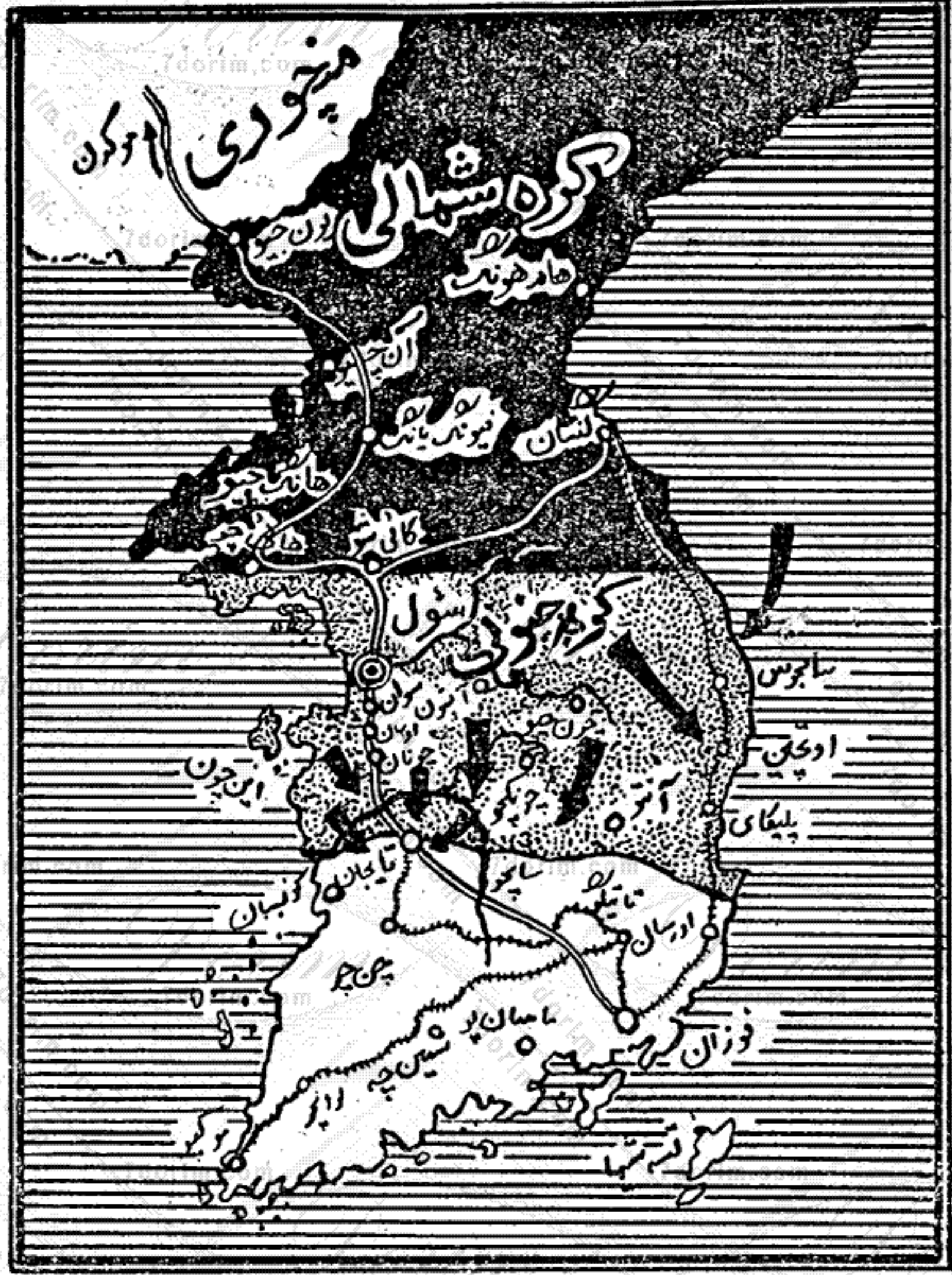
نقشه جنگ کره

وقایع مناصر گره، همه ملاحظیات و یاد آوریهای را که در این مقالات اظهار گردیده بود تأیید می کند، و همچنین یک اصل اساسی و کلاسیک استراتژی را توأم با جدیدترین نظریه بقیه در صفحه ۳