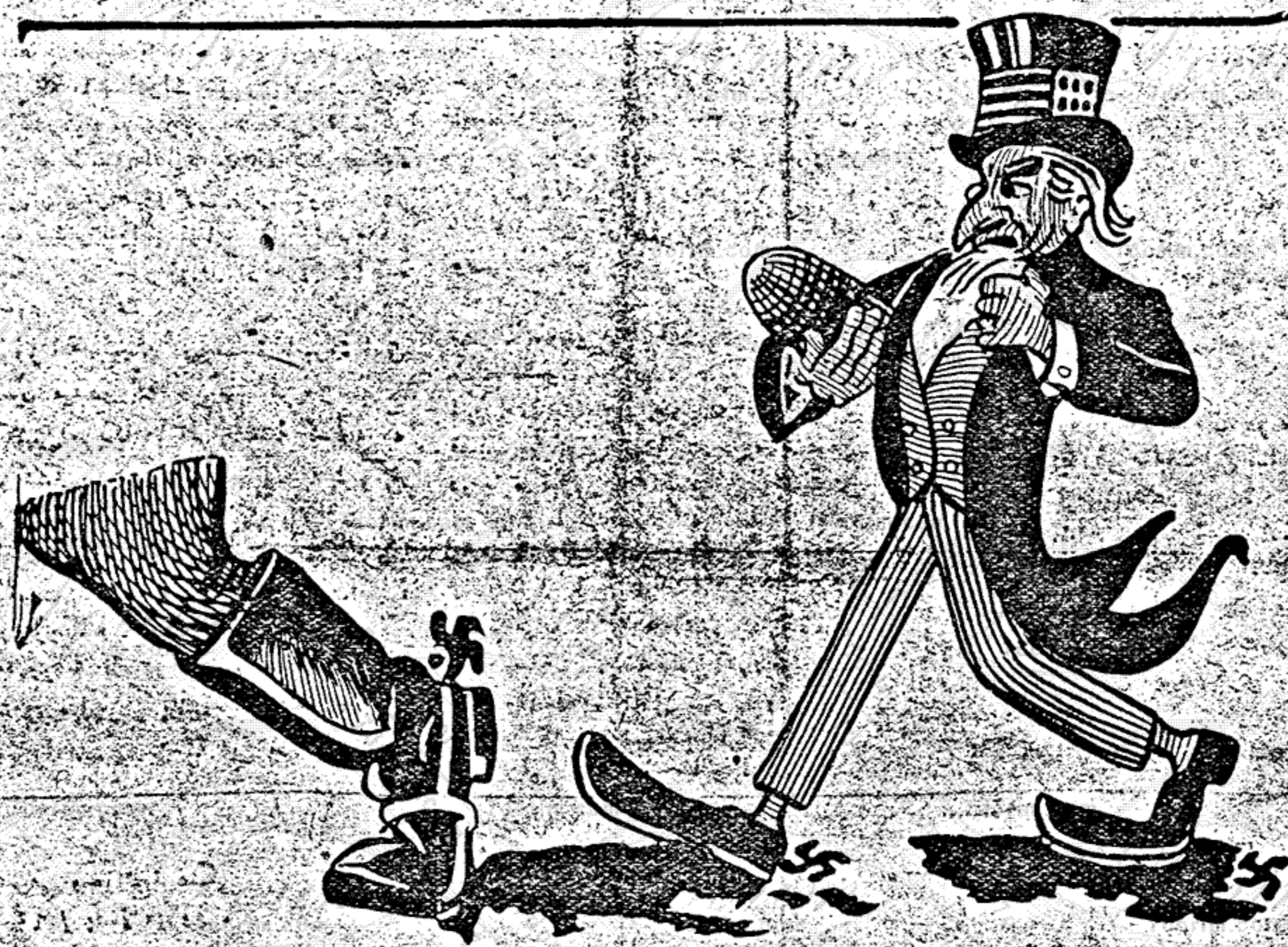
امپریالیسم خونخوار در طریق فاشیسم جهانخوار تمام بر میدارد

سرایای این اصمال با اصلاح قضائی مغشوش و مخالف بدیهی ترین اصول و موازین قانونی است، زیرا اولاً قرار باز پرس نظامی همچنانکه ضمن آن مندرج است باستناد قرار صادره از باز پرس شبهه «تهام» مبنی بر «عدم صلاحیت» صادر گردیده است و حال آنکه «قرار باز پرس تهران خود سرانجام خلاف قانون بوده است و مادر مقاله هفته گذشته، با دلایل دیده، این مدعا را بشود «سنادیم» باز پرس دادسرای تهران باستناد اینکه گویا یکی از موارد اتهام «تشکیل فرقه اشتراکی» است و چون رسیدگی باین اتهام در صلاحیت مراجع نظامی است بقیه در صفحه ۸